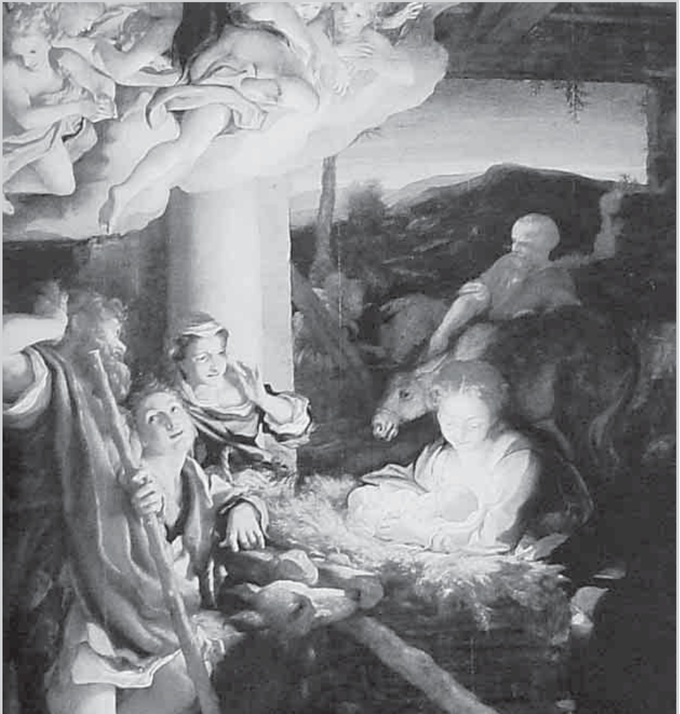
Corregio La natividad , h. 1530. Óleo sobre tabla, 256x188 cm; Galería de Pintura de Maestros Antiguos, Dresde

BOGOTÁ, D. C. / COLOMBIA / NOVIEMBRE 2003 / NÚMERO 69