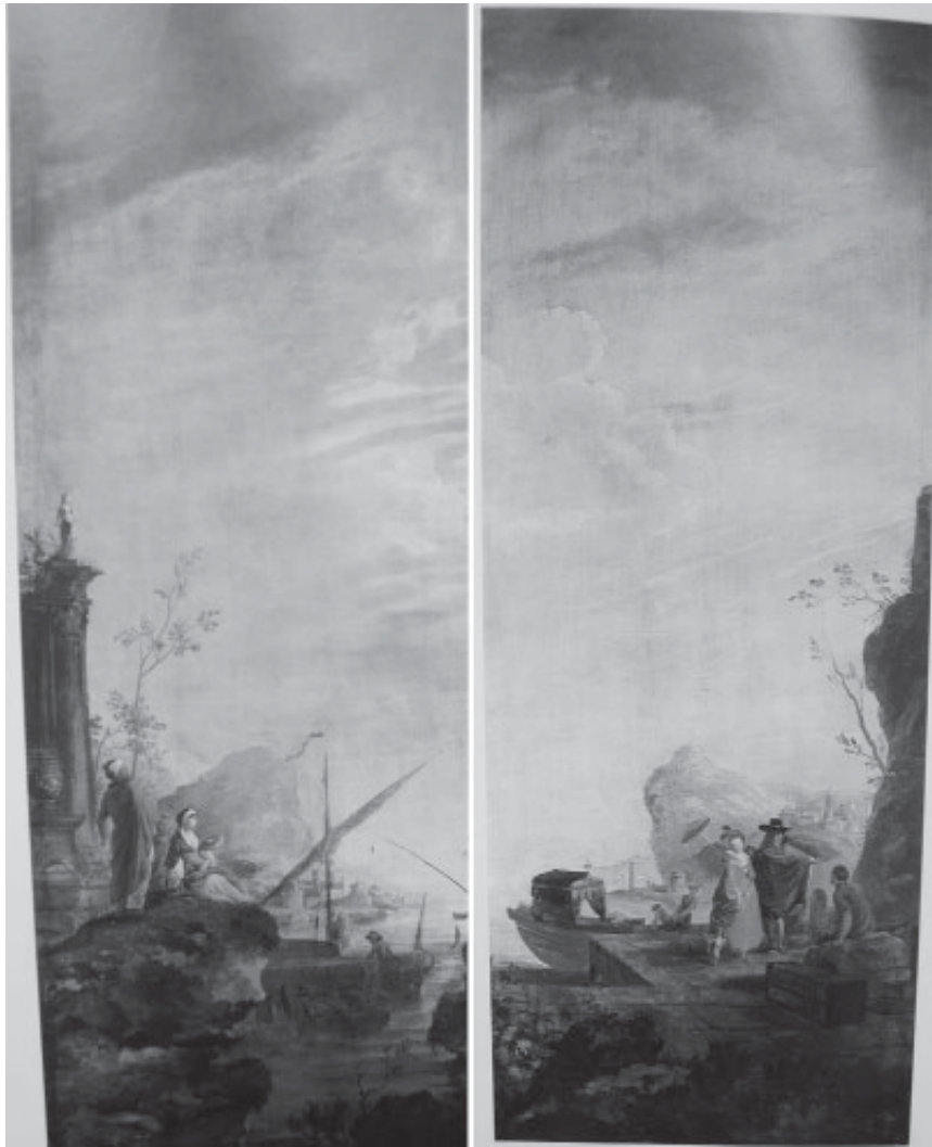
Agostino Brunias Figuras turcas cerca del agua y Figuras elegantes en un puerto 1786, Óleo sobre lienzo

Donación particular a la Fundación Amigos de las Colecciones de Arte del Banco de la República, 2004