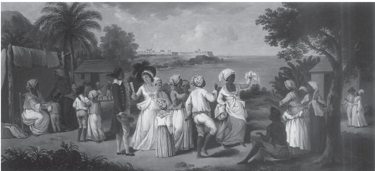
Agostino Brunias, Baile de negros en la isla Dominica (o San Kitts)