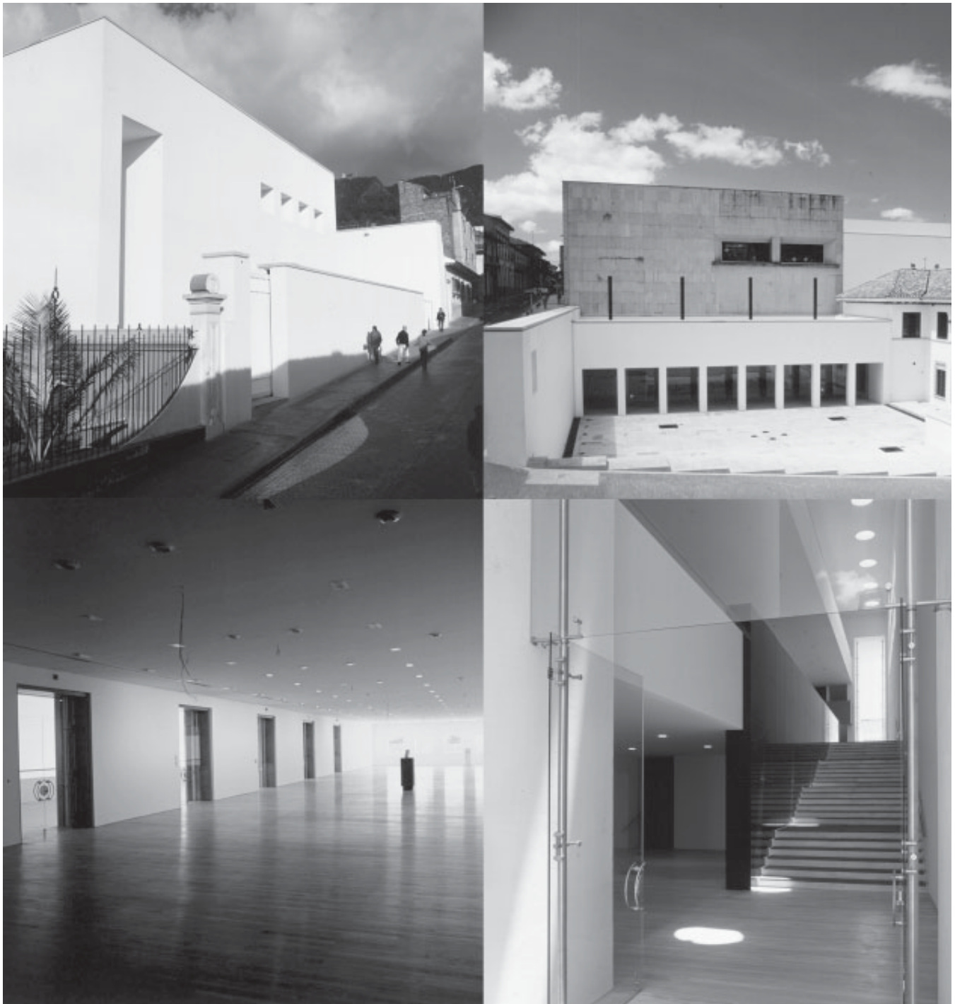
Inauguración del Museo del Banco de la República

B O G O T Á , D . C / C O L O M B I A / M A Y O 2 0 0 4 / N Ú M E R O 7 4