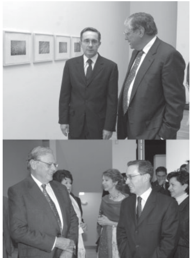
El Señor Presidente de la República, Doctor Alvaro Uribe Vélez, junto al Señor Director del Banco de la República Miguel Urrutia Montoya, el día de la inauguración del Museo del Banco de la República

Para dar unidad al conjunto arquitectónico de la manzana cultural se rediseñó la plazoleta Arce y Ceballos, de manera que el público pudiera entrar a todas las zonas de exposición a través de un amplio espacio abierto, al lado del cual se ha instalado un café Juan Valdés. La fachada oriental del Museo Botero, que estaba oculta en buena parte por la plan-