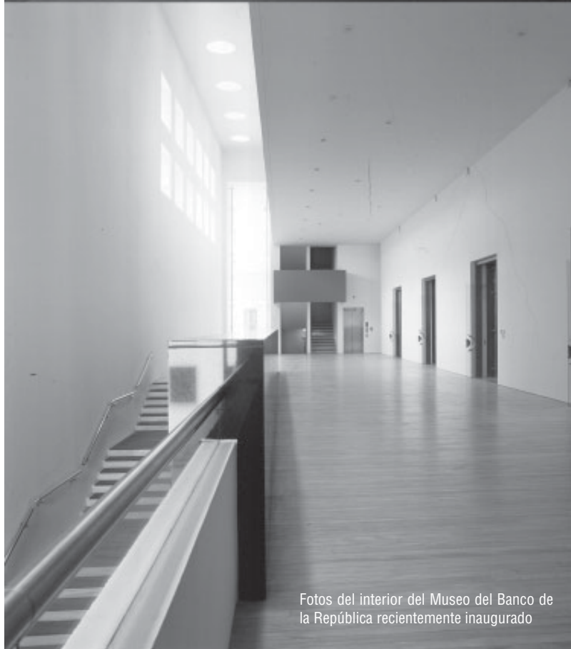
Fotos del interior del Museo del Banco de la República recientemente inaugurado

Por otra parte, la Casa de Moneda, una valiosa construcción colonial, se destinó desde 1996 a la exposición de las colecciones de moneda y billetes. En sus salas es posible seguir la historia de Colombia a través