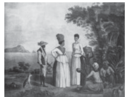
Agostino Brunias, Mercado de frutas en San Vicente .

Brunias muere en 1796, en Rousseau, la capital de Dominica, dejando tras de sí un inmenso legado pictórico tanto para las islas que visitó como para la recuperación de documentos valiosos para los ojos europeos. Su obra ha sido siempre muy apreciada tanto por el público como por grabadores de la época y posteriores que la adoptaron en sus reproducciones.