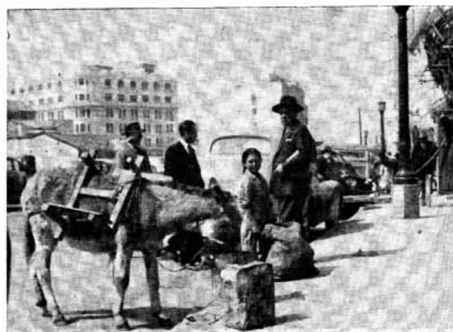
EL BURRO EN COMPETENCIA CON EL AUTOMOVIL