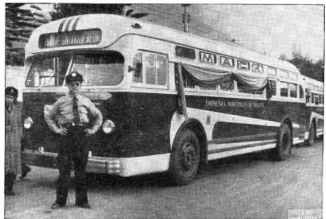
ULTIMO MODELO DE AUTOBUS MUNICIPAL

Hoy la Empresa del Tranvía Municipal de Bogotá con sus 70 tranvías y sus 40 autobuses transportan en promedio diario de 163.000 pasajeros. El promedio para las empresas privadas de transportes colectivos en 650 vehículos asciende a 350.000 pasajeros.