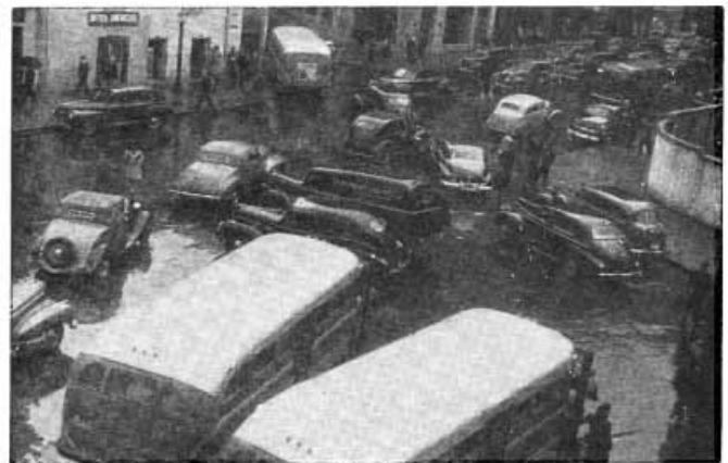
ASPECTO TIPICO DE LA CIRCULACION EN BOGOTA