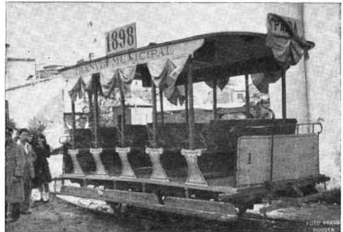
EL PRIMER TRANVIA, ACCIONADO CON MULAS

Para 1828 los historiadores le adjudican a Bogotá, en materia de vehículos, la carroza del arzobispo, el landó del cónsul británico y la caleza de Bolívar. Con los albores del siglo XX se presentan en Bogotá la manifestación de los transportes mecánicos; llegó representada por un automóvil marca "Essex" que en 1902 importó el señor Duperly.