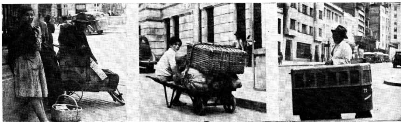
MODALIDADES DE TRANSPORTE URBANO MUY USUALES EN BOGOTA ACTUALMENTE