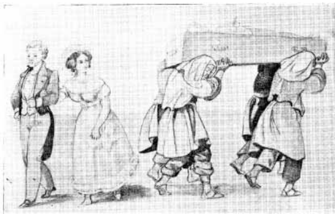
ANTIGUA MANERA DE CONDUCIR LOS CADAVERES