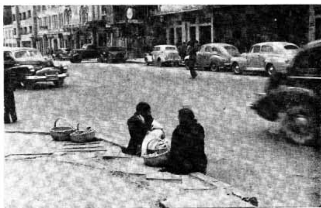
VENDEDORAS AMBULANTES EN ESPERA DE CLIENTES