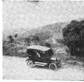
Este fue uno de los 13 automóviles que tuvo Bogotá en 1911