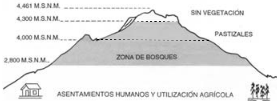
Esquema 1: La Malinche: vegetación en los diferentes niveles altitudinales

Fuente: INEA, Ecología del Estado de Tlaxcala. Región Malinche , México, SEP-INEA, 1995, p.19.