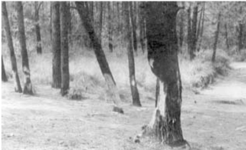
Foto 1: El descortezamiento de árboles para la extracción de trementina: una forma de deterioro ambiental en los bosques de La Malinche