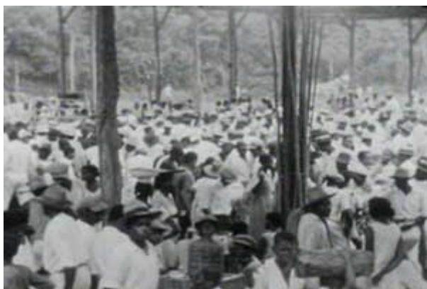
A journey to the operations of the South American Gold Platinum Co., in Colombia South America (1937).

A journey to the operations of the South American Gold Platinum Co., in Colombia South America Blanco y negro, 16mm – 14 min. 57 seg. 1937.