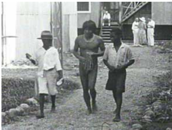
A journey to the operations of the South American Gold Platinum Co., in Colombia South America (1937).

La South American Gold Platinum Company empresa de capital inglés que por la época en que se realizaron las filmaciones mantenía el monopolio de la explotación aurífera en el occidente de Colombia, introdujo un cambio tecnológico al utilizar, en sustitución de las prácticas artesanales, grandes dragas para buscar el oro en el lecho de los ríos.