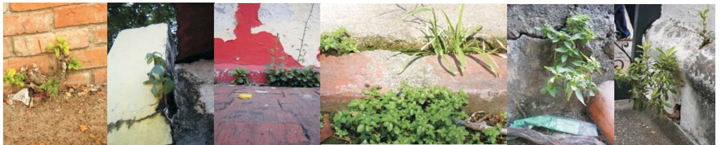
manifestación natural de la flora

Conversatorios. Una vez terminado el trabajo de taller se realizaron conversatorios con los participantes, con el fin de intercambiar experiencias en torno al dibujo, a las investigaciones adelantadas por cada integrante en torno a la flora dibujada, se indagó sobre el valor del taller para cada persona, se escucharon propuestas para el mismo y sobre todo se posibilitó el reconocimiento de cada uno de los participantes, pues son estos el capital fundamental del proyecto.