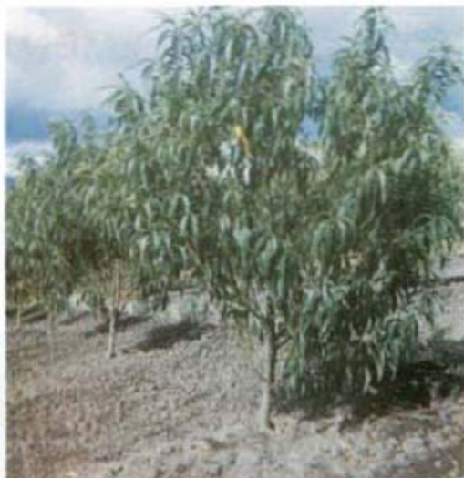
ARBOLES BIEN DESARROLLADOS

Además de los elementos mayores , las plantas requieren de otros elementos secundarios tales como: Calcio, Magnesio y Azufre; y elementos menores como Molibdeno, Cobre, Cobalto, Hierro, Zinc, Boro, Manganeseo y Cloro, para su normal desarrollo.