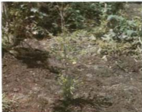
ARBOL RAQUITICO POR DEFICIENCIA DE NUTRIENTES

Cada especie de cultivo, extrae determinadas cantidades de nutrientes por hectárea.