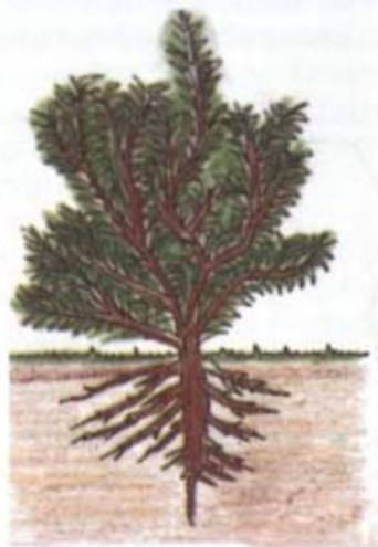
VARIEDAD DE PORTE BAJO

A MAYOR PORTE DE LA ESPECIE Y/O VARIEDAD SE DARA MAYOR DISTANCIA DE SIEMBRA.