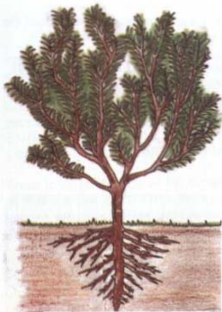
VARIEDAD DE PORTE ALTO