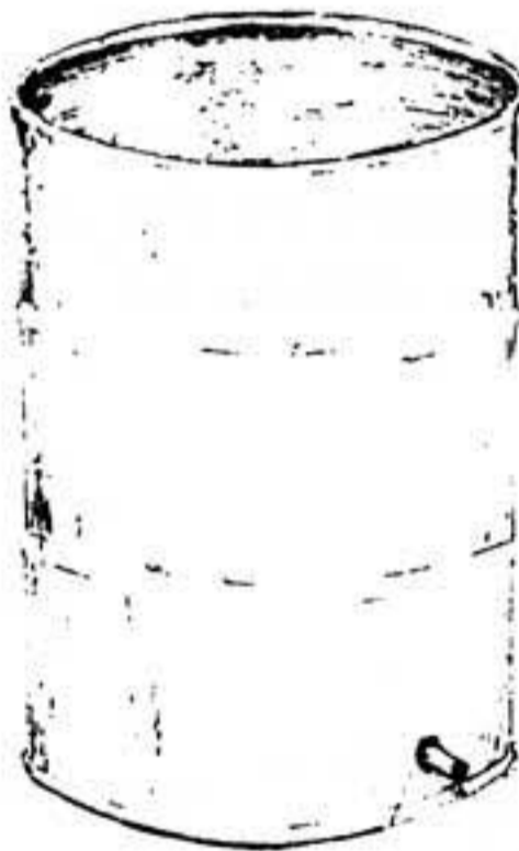
Figura No. 4