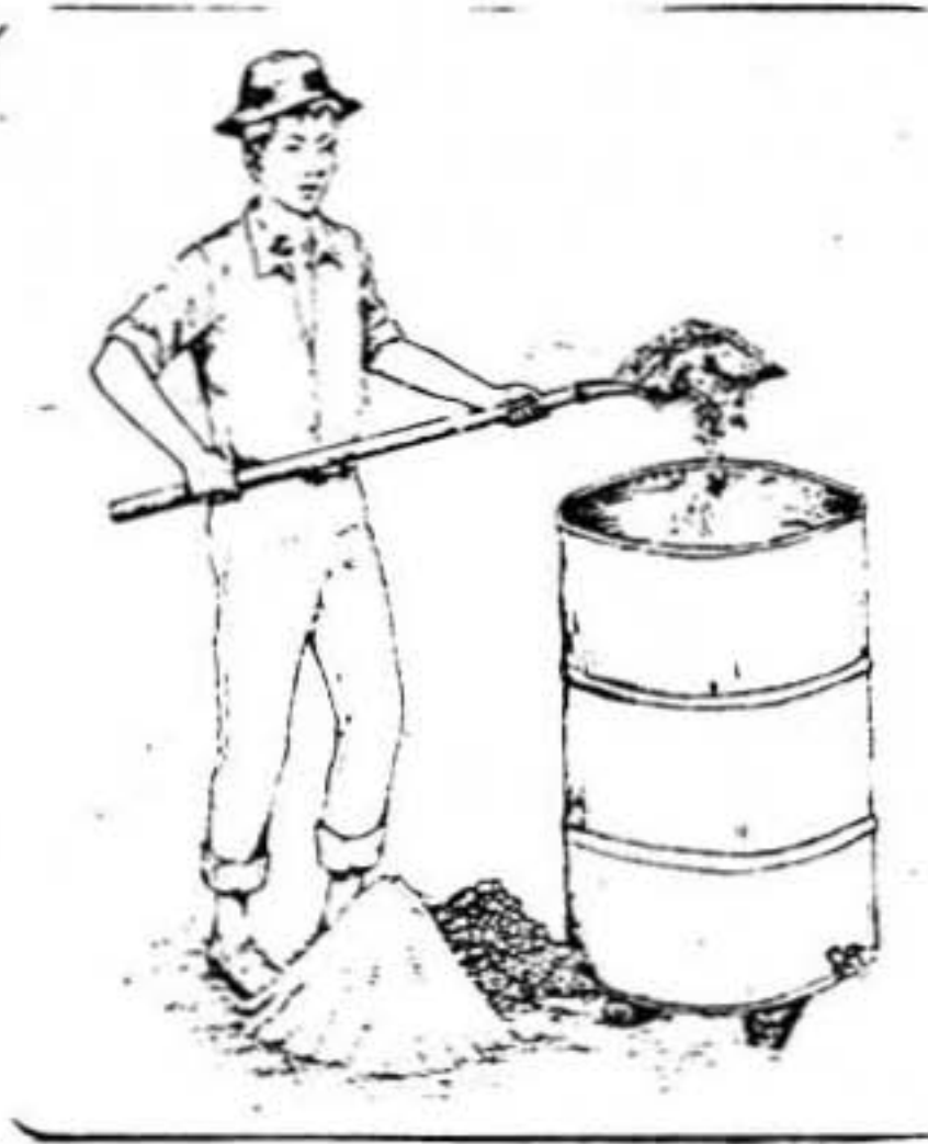
Figura No. 10