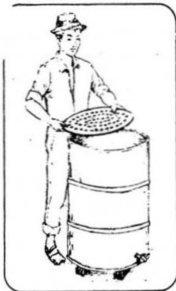
Figura No. 11