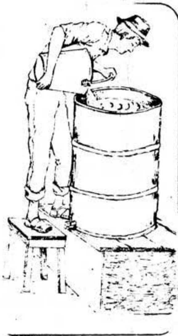
Figura No. 12