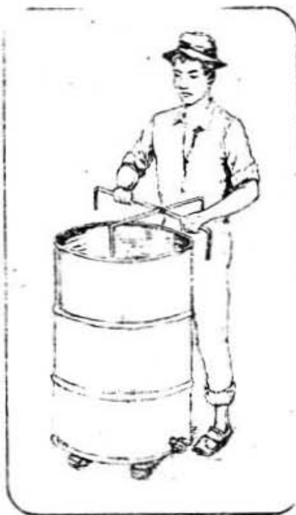
Figura No. 8