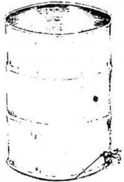
Figura No. 5