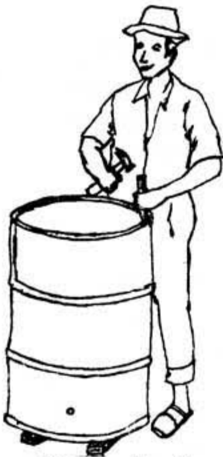
Figura No. 3