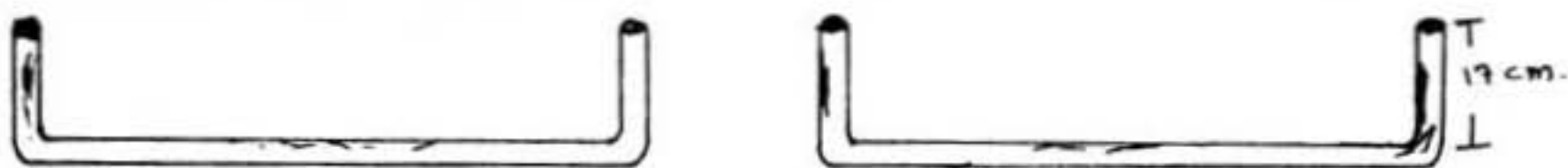
Figura No. 6