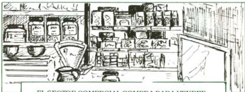
EL SECTOR COMERCIAL COMPRA PARA VENDER.

Se compra algo para satisfacer una necesidad o para venderlo por mayor precio. Se vende algo para obtener una UTILIDAD ECONOMICA.