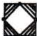
Troncal del Caribe Mingueo