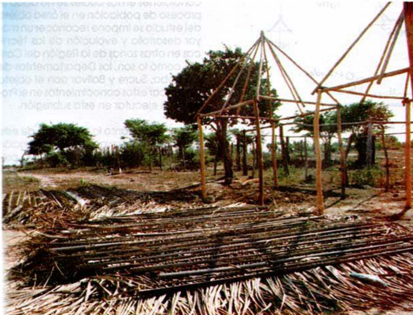
Construcción actual Dibull

En las tecnologías tradicionales de construcción que allí se aplican, los componentes los constituyen: los recursos naturales que se obtienen en el sitio y en los alrededores inmediatos; y el conocimiento tradicional desarrollado en mayor o menor grado en diferentes sitios de la Región.