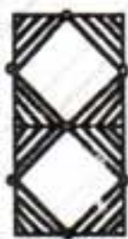
"La Casa de Palma"