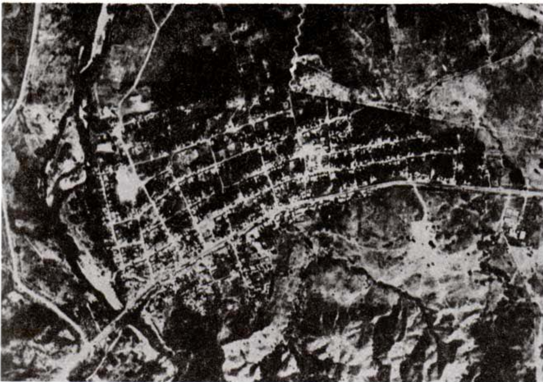
Foto Aérea Corregimiento de Mingueo

En la actualidad cuentan con la presencia, programas y acciones de algunas entidades del Estado como: SENA, ICA, PNR, DRI, ICBF.