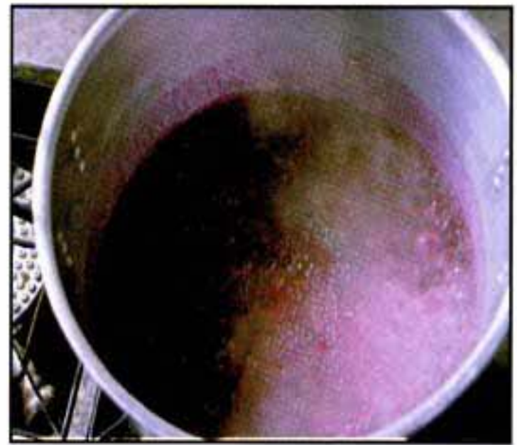
Diap. UVA 6.2 Recipiente cocinando uva