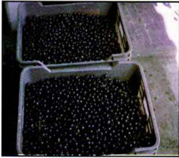
Diap. UVA 6.1 Uva Isabella para proceso