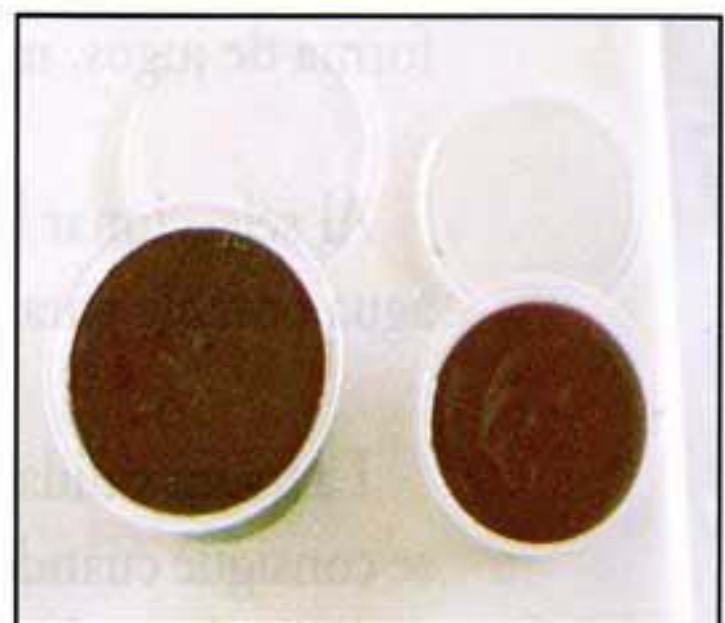
Diap. UVA 6.6 Mermelada de uva Isabella