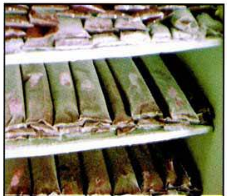
Diap. UVA 6.4 Pulpa almacenada y congelada