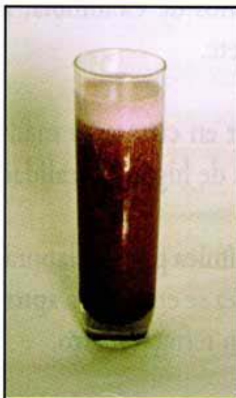
Diap. UVA 6.5 Jugo en agua