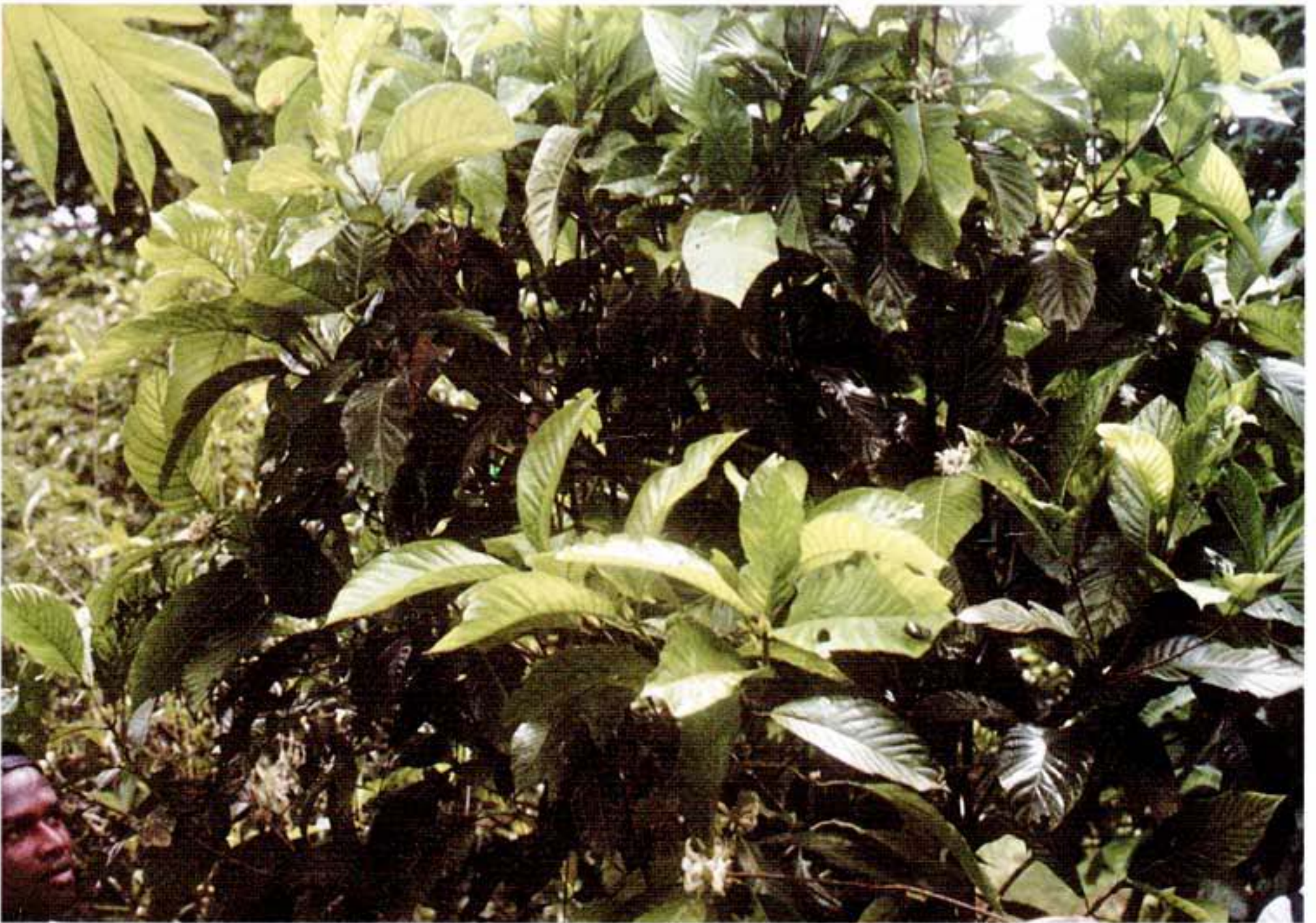
Figura 1.5 Flor femenina en árbol y solitaria.