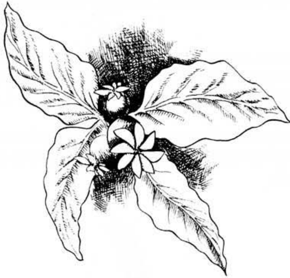
Figura 1.6 Zona terminal de rama con tres flores.