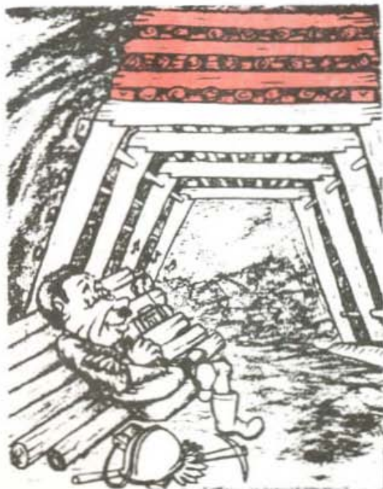
Canasta bien colocada