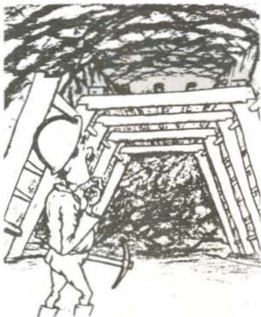
Vacío en el techo