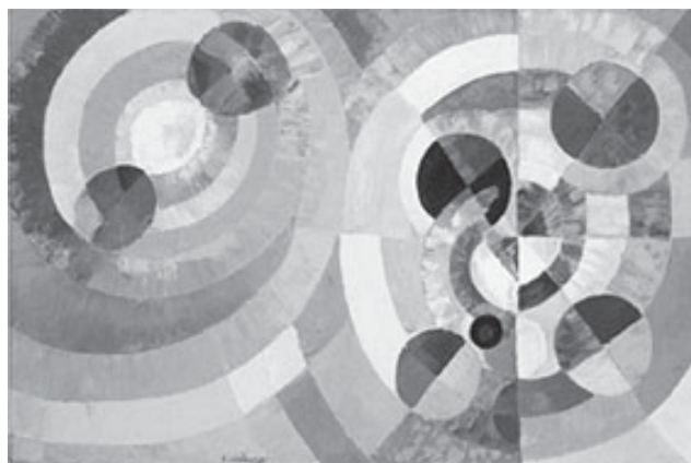
Robert Delaunay, Circular Forms , 1930. Solomon R. Guggenheim Museum, New York

A pesar de la gran cercanía de su obra, la trascendencia que ella tuvo para el desarrollo posterior del arte tomó rumbos diferentes. Mientras la obra de Robert Delaunay es considerada en toda la literatura especializada como una de las más relevantes para entender el proceso de