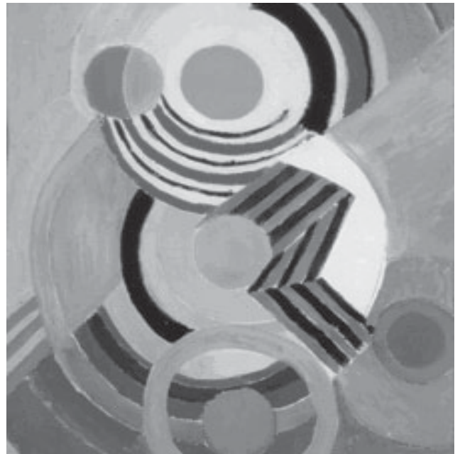
Sonia Delaunay. Sin título, 1945 Gouache y collage sobre papel Museo Botero - Colección Banco de la República

Esto lo realizó de una manera espontánea, insatisfecha de pronto por las calidades estáticas de la pintura, diseñando sus famosos vestidos simultáneos que tanto influenciaron a sus contemporáneos no sólo en París sino en lugares como Italia en el movimiento futurista. Según afirmaba el mismo Robert, esta libertad del color aplicado a sus objetos lo influenció a él en la liberación del mismo en su obra: “Los colores son destellantes. Tienen el semblante de esmaltes o cerámicas, de tapetes; esto es, que ya hay en ellos un sentido de las superficies que se combinan, uno diría, de manera exitosa en el lienzo”. Esta misma sensación es la que se obtiene al apreciar la pieza del Banco: esta artista de origen ruso, logró plasmar en ella el sentido de las superficies, maestralmente combinadas a través del contraste de color, para lograr una composición simultánea de gran impacto visual.