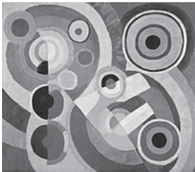
Sonia Delaunay Rhythm Joie De Vivre , 1930

“... desde el día en que empezamos a vivir juntos, yo jugué en la mitad de la cancha y nunca me puse de primero hasta los años cincuenta. Robert era brillante y tenía el olor del genio. Yo vivía en una mayor profundidad”.