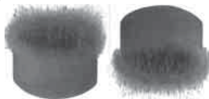
Delcy Morelos Paradigmas del ser calcinado (1 y 2) 1994

Acrílico sobre papel (díptico) 161 x 164 cm cada pieza