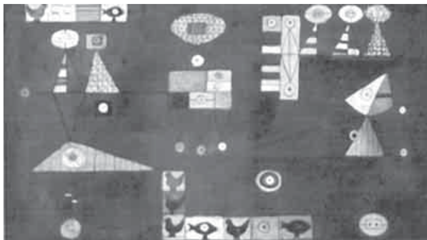
René Portocarrero / Tiro al blanco , 1952 / Pintura, óleo sobre tela, 41.3 x 73 cm / registro AP3205

Esta serie de Tiros al blanco que desarrolla en los años cincuenta, podría considerarse como un pequeño descanso de transición entre sus series de los años cuarenta y las que vendrían en las décadas posteriores. De al-