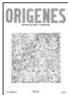
Revista orígenes , otoño 1946 Portada de René Portocarrero

Vale la pena mencionar que además de ser un gran pintor y haber realizado numerosos murales en edificios públicos, Portocarrero incursionó en la cerámica, el diseño gráfico, el diseño para teatro y la ilustración de libros. En esta última actividad participó activamente en la revista de arte y literatura Orígenes liderada por José Lezama Lima. También se destacó como gran dibujante con su serie Figuras para una mitología imaginaria de 1943. Publicó dos libros con textos y dibujos propios: El Sueño en 1939 y Las Máscaras en 1935. Una edición de este último se encuentra también en la colección del Banco gracias a una donación recibida por uno de los integrantes de la Fundación de los Amigos de las colecciones de arte. En esta serie se subrayan una vez más los intereses recurrentes en la temática de Portocarrero, especialmente aquellos relacionados con la recuperación de la ancestralidad y la tradición cubana.