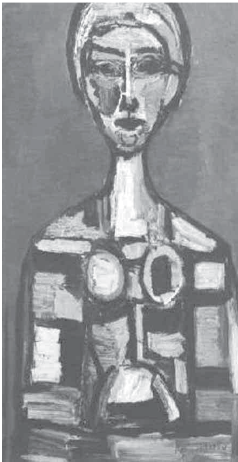
René Portocarrero Mujer, años 50