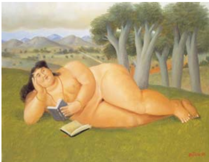
Fernando Botero / Mujer leyendo / 1998 / Óleo sobre lienzo / 48,26 x 37,46 cm