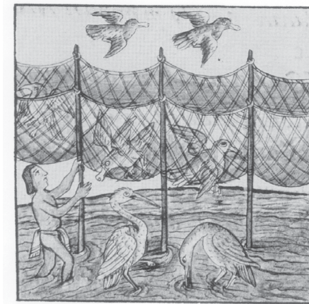
Imagen n° 1: Cacería de patos, Códice Florentino, siglo XVI

Fuente: MARÍA Y CAMPOS, Teresa de, op. cit. , p. 40.