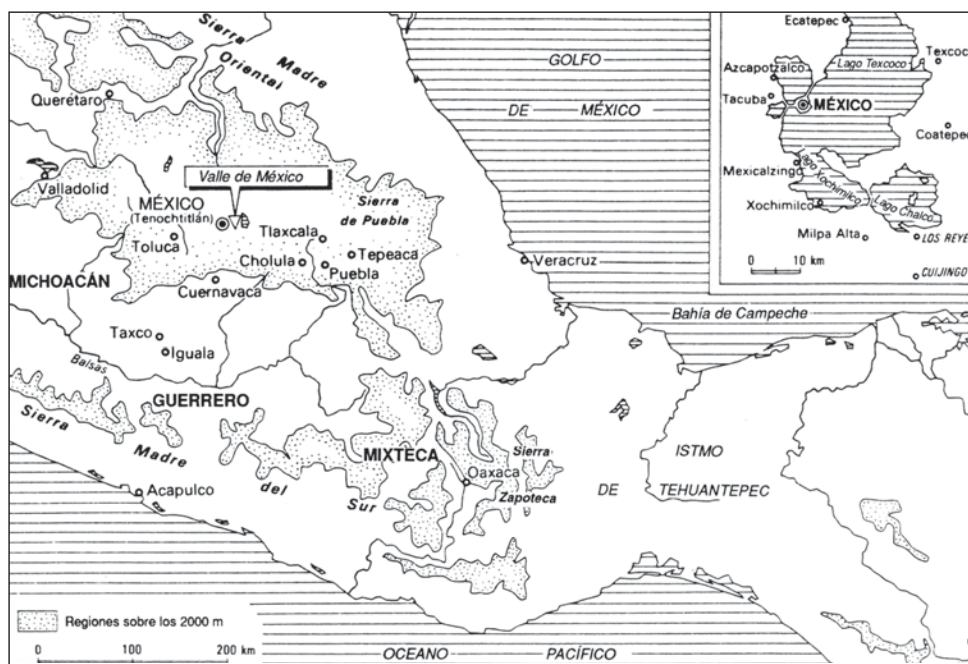
Mapa n° 1: El Valle de México