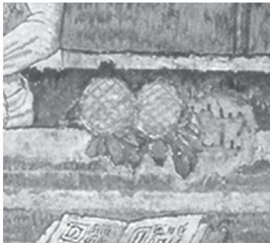
Imagen n° 5: La Misa de San Gregorio: detalle de dos piñas

Fuente: ESTRADA DE GERLERO, Elena Isabel, "La Plumaria...", op. cit.