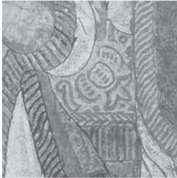
Imagen n° 6: La Misa de San Gregorio: detalle de piña