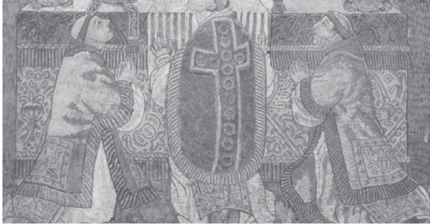
Imagen n° 7: La Misa de San Gregorio: detalle de la decoración de las mantas de los sacerdotes y de la tela que desciende frente al altar

Fuente: ESTRADA DE GERLERO, Elena Isabel, "La Plumaria..." op. cit.