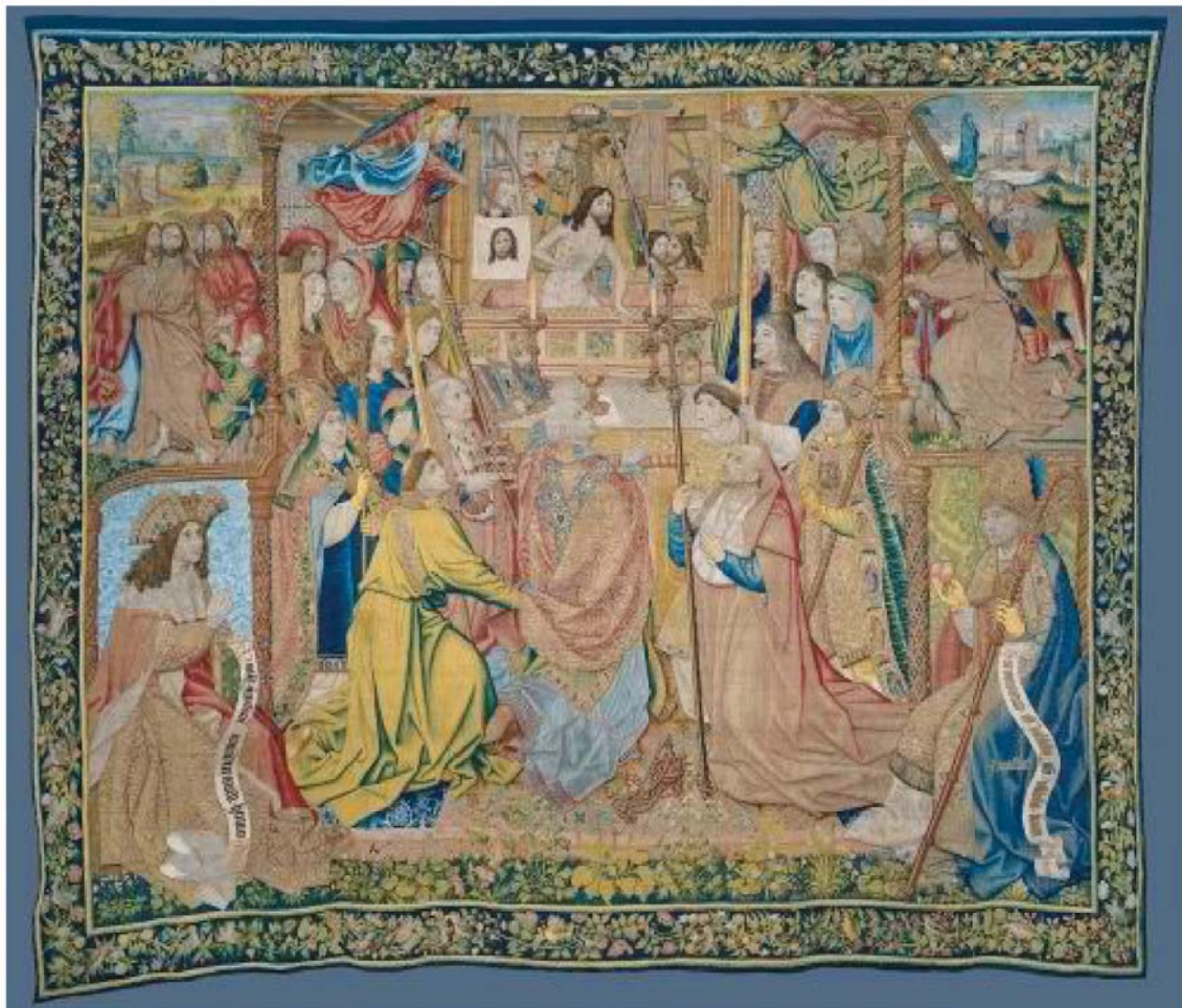
Imagen n° 8: La Misa de San Gregorio de Colyn de Coeter