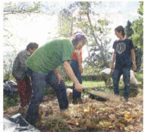
'La otra' incluye talleres de agricultura y una radio comunitaria, entre otras actividades.

"Por supuesto que mi obra ha tenido influencias del entorno y la cultura, pero ha madurado. Llegó el momento en que se puede sacar una conclusión sobre mi recorrido, y poner en su lugar la evolución y sentido de mi trabajo".